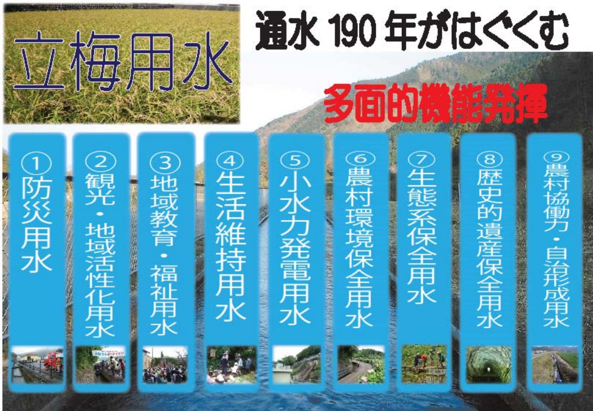
表（1）立梅用水の多面的機能発揮

いずれにしても、これらの地域用水機能は立梅用水が有する慣行水利権内に従属されるものであるが、用水の利用実態からみると「用水の多目的水利によるもの」、「周辺施設を含めた用水施設の多目的利用によるもの」、「用水の文化価値を多目的利用するもの」に分類することが出来よう。一般的に農業農村の多面的機能発揮の評価としては、農地の生産活動に伴う潜在的な発揮として評価されがちであるが、農業用水の場合には、地域性に応じた利用価値を育む多くの人びとの関わりのもと必然的に発揮されるものが多い。