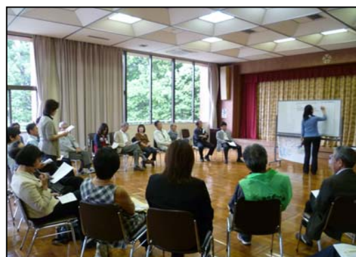
(写 8) 多気町勢和地域資源保全・活用協議会