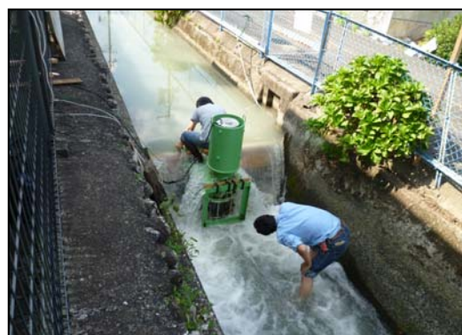
(写 5)地域教育・福祉用水(立梅用水紙芝居)利用 (写 6)小水力発電用水(発電実験)利用