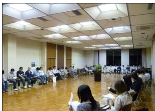
(写 7) あじさいまつり実行委員会

地域資源である「水や土」に最も精通し、直接管理しているのが水土里ネットであるが、地域の人びとにとっては地域資源を保全し、活用する活動となれば水土里ネットが関与することで安心して活動が出来る。又、水土里ネットにとってもその軸足を地域住民のもとに置くことで、存在そのものが地域の人びとに分かりやすくなる。しいては水土里ネットの運営そのものを活性化させている。地域活動の 25 年を振り返ると、確かに忘れかけた地域の絆づくりと「農村協働力の向上」に寄与し、地域用水としての利用は、多くの人びとの関わりと共に、その利用は高度化しつつある。