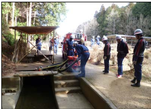
(写3)防災用水(消火訓練)利用

この地域用水としての維持・活用は、国の制度で進める農地・水・環境保全活動(農地・水保全管理支払交付金制度)の推進母体である「多気町勢和地域資源保全・活用協議会(多様な主体19団体、4支援組織)」が水土里ネット立梅用水と共同で行っている。