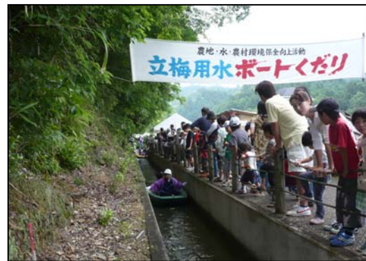
(写4)観光・地域活性化用水(あじさいまつり)利用