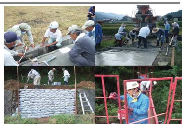
施設の維持補修(農地・開水路・パイプライン・ため池・農道)