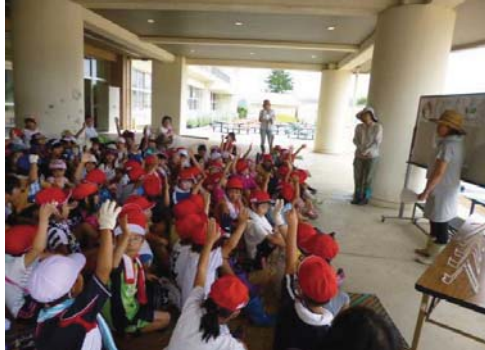
勢和小学校全校 まめ作り