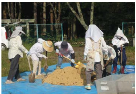
生ごみの堆肥づくり