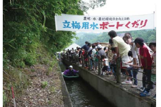
勢和中学生 あじさいまつりボランティア