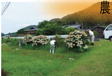
あじさいいっぱい運動