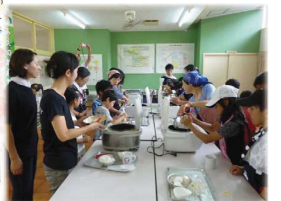
親子料理体験教室