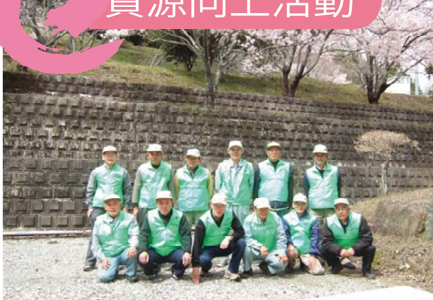
水土里サポート隊(農家・非農家含む12名で構成)