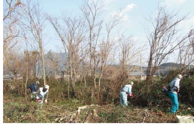
遊休農地発生防止のための保全管理