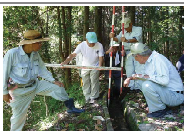
施設の点検・機能診断活動