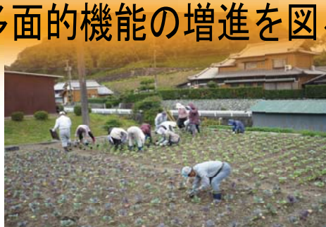
休耕田を利用した景観形成活動