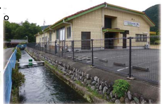
6次産業施設「ゆめ工房」と「彦電」