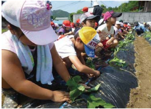
勢和小学校1・2年生さつまいも作り