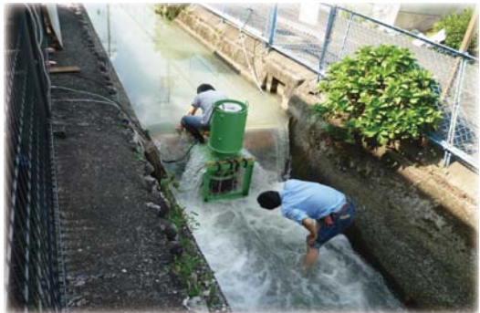
立梅用水型 小水力発電機「彦電」

平成24年度から始まった小水力発電プロジェクトは、6次産業・教育・福祉など、さまざまな方向から地域活性化を実践しています。