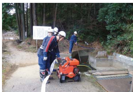
農業用施設を活用した防火・環境用水