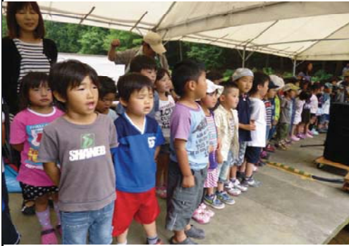
保育園児によるイメージソング「水土里」田んぼのコンサート