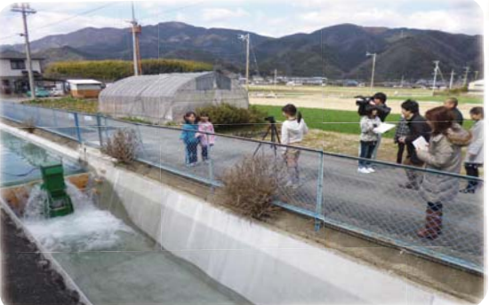
子どもビデオリポートの制作