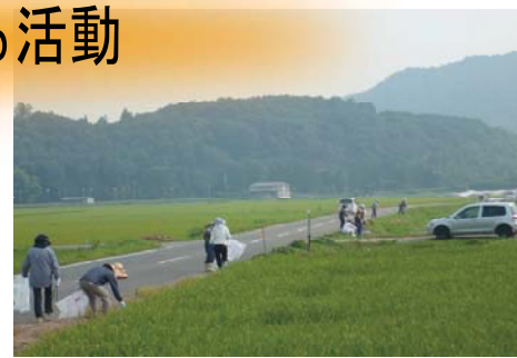
施設等の定期的な巡回、清掃