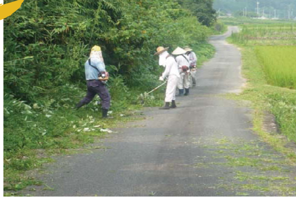
農家・非農家による農道や開水路の草刈り作業