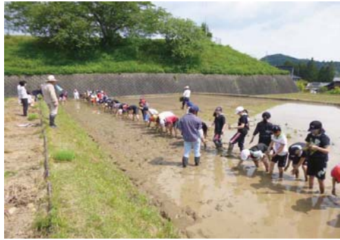
勢和小学校5年生 こめ作り・水の道しらべ