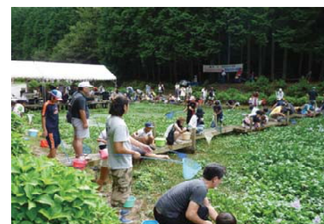
生態系保全・農村のビオトープづくり