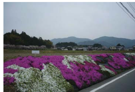
グランドカバープランツ