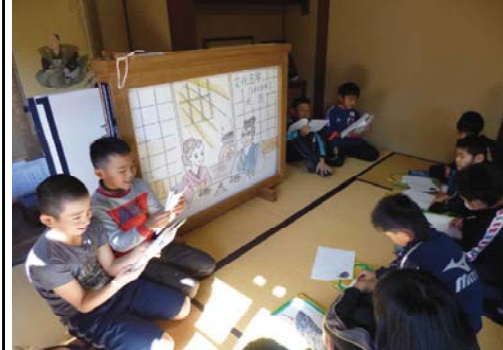
勢和小学校4年生立梅用水学習